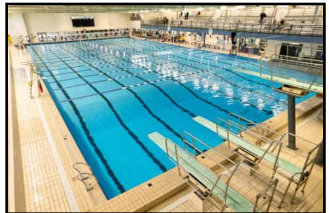
Une entente de principe qui marque une avancée importante pour les membres du secteur aquatique grâce à des améliorations salariales, une meilleure reconnaissance des fonctions et des conditions de travail bonifiées.