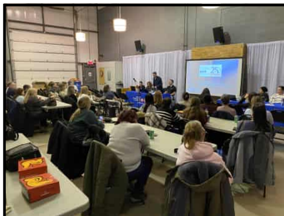
Les échanges, les bilans et les nombreux dossiers présentés témoignent du dynamisme et de la solidarité de notre section locale.

Le comité exécutif tient à remercier chaleureusement toutes les personnes présentes pour leur participation et leur intérêt envers la vie syndicale. La solidarité et l'engagement des membres demeurent au cœur de la force de notre section locale.