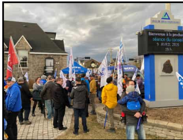
Des membres SCFP de différentes sections locales étaient présents en soutien à leurs collègues cols blancs lors de ce rassemblement qui se tenait face à la salle du conseil de la Ville de Deux-Montagnes.